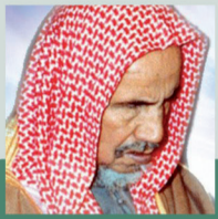
العلامة . عبد العزيز بن باز - رحمه الله -